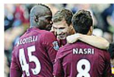
Ozeko tra Balotelli e Nasri: City felice