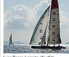
Luna Rossa è pronta alla sfida