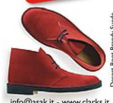
Desert Boot Brandy Suede